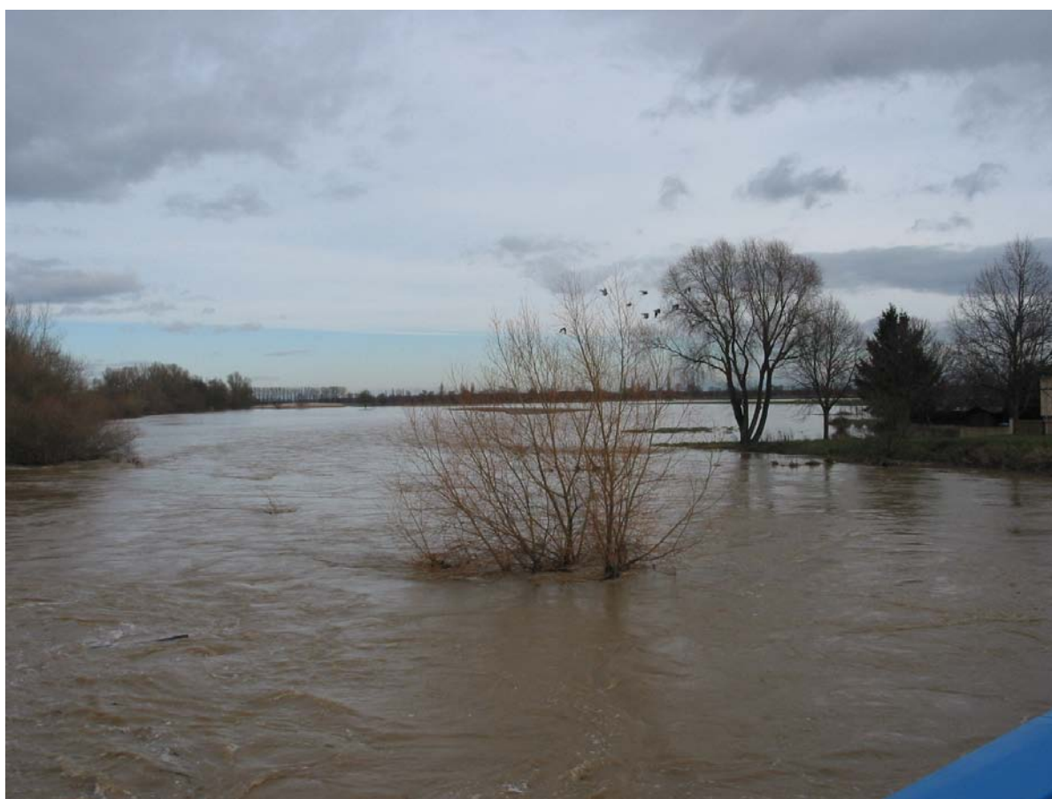
L' Ill à Ruelisheim en janvier 2004