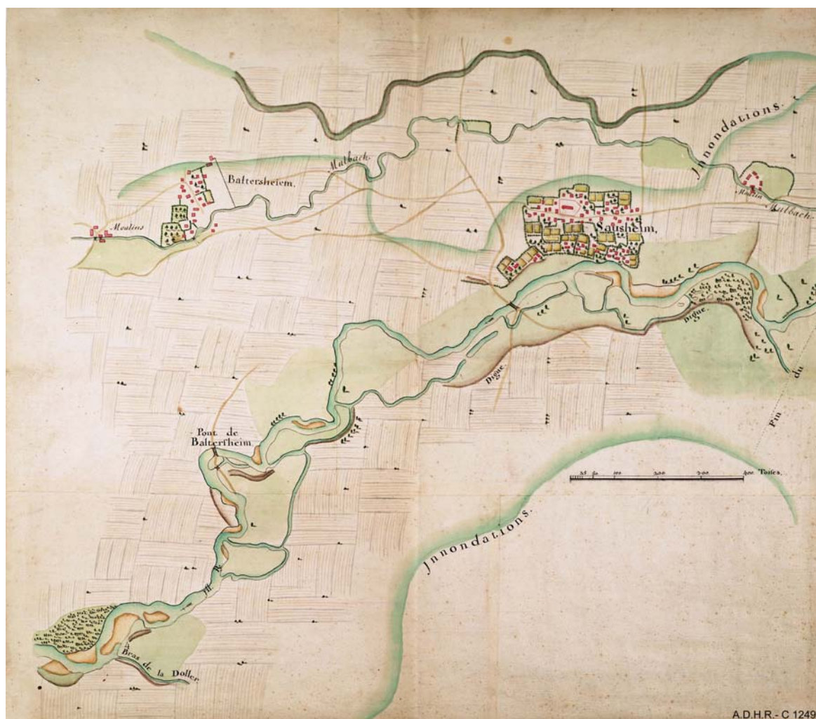
Emprise de la zone inondable à Baldersheim et Sausheim (Intendance d'Alsace-1751)

L'analyse des crues par le passé montre que celles-ci ont été très fréquentes, et très destructrices. Les chroniqueurs parlent ainsi fréquemment de l'inondation de la totalité de la plaine d'Alsace entre Rouffach et Brisach, due souvent à la conjonction des crues de l'Ill et du Rhin. C'est ainsi qu'ont été recensées 6 crues ayant fait d'importants dégâts au cours du XVIIIème siècle et 11 crues au XIXème entre 1800 et 1863 (cf l'ouvrage de Maurice Champion: "les inondations en France de puis le VIème siècle jusqu'à nos jours"). Des cartes anciennes nous montrent l'étendue du champ d'inondation avant la réalisation des travaux d'aménagement.