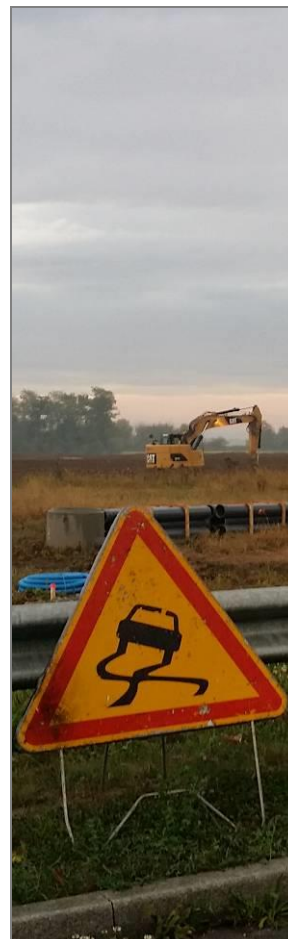
Travaux ZA - Novembre 2016