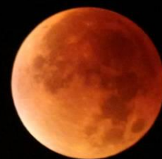
"Super-Lune rouge" lors de l'éclipse lunaire du 28/09/15 Meyenheim