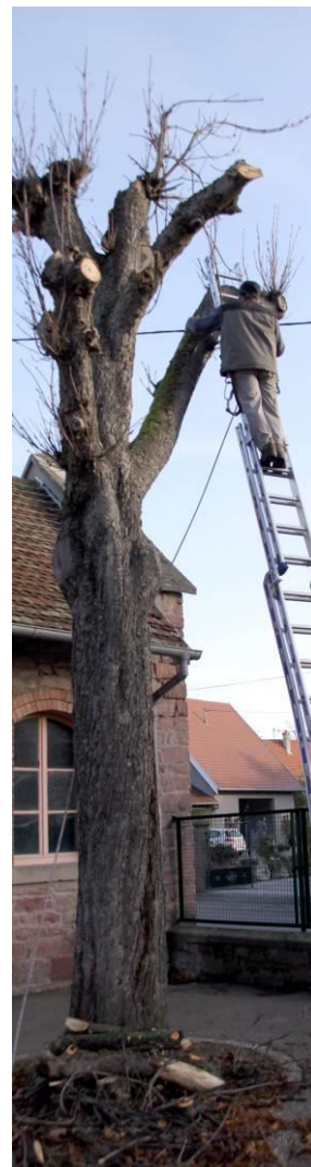
Abattage d'un marronnier Ecole des filles Nov. 2014

Quand on donne le petit doigt au diable, il prend immédiatement la main entière.