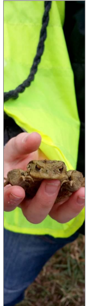
Jeune femelle crapaud Ramassage BUFO - Site de reproduction de Meyenheim - 20/03/2016