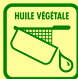
B - Huiles végétales