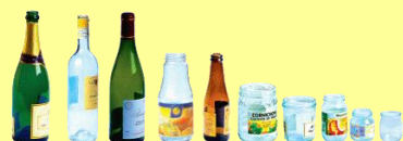
F - Bouteilles, pots, bocaux et flacons