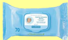
H - Lingettes bébé