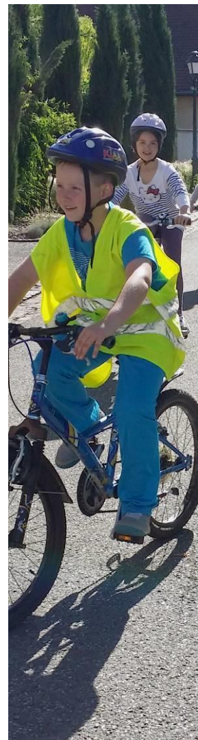
Journée vélo dans les écoles Juin 2015