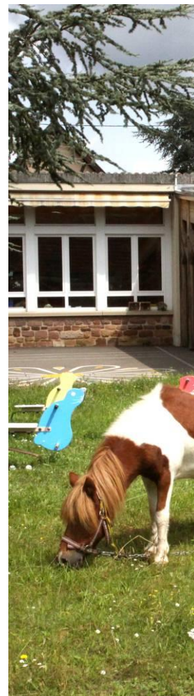
Tonte écologique par Billy Ecole maternelle Aout 2014